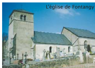
L'église de Fontangy

13 Tout droit jusqu'à l'intersection des routes goudronnées, prendre en face sur 300 m.