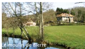
Le moulin de Bierre

Option 12 km : passer le pont de la Ramée et se diriger vers le Moulin de Bierre et sa grande roue.